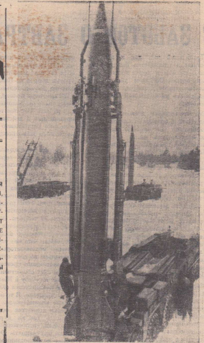
В район стартовой позиции ракетные установки пришли в точно указанное время.

Готовясь достойно встретить XXIV съезд КПСС, Советские Вооруженные Силы как бы подводят итоги своей деятельности. И какую страницу их истории ни откроешь, какую сторону сегодняшней жизни армии и флота ни возьмешь — всюду видна руководящая и направляющая роль Коммунистической партии. Гению Ленина, партии обязаны наши Вооруженные Силы своим рождением, обу-