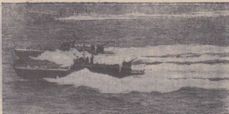
Торпедные катера на учениях.

Надежный бастион мира на нашей планете — социалистические страны, Организация Варшавского Договора. КПСС, как и другие